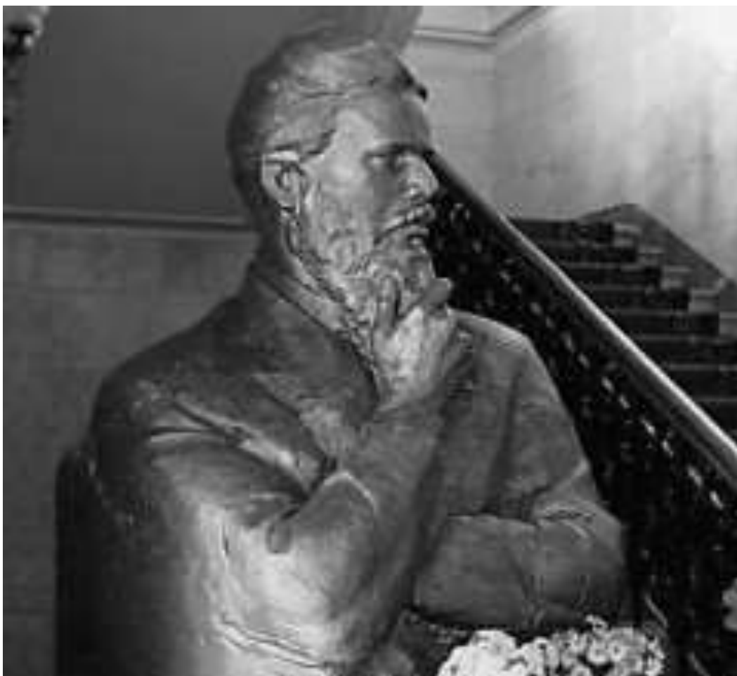
1924 — Сергей Иосифович Параджанов, кинорежиссёр.

время, в частности, - это децентрализация и оказание многообразных форм психиатрической помощи, развитие психосоциальной реабилитации, повышение качества жизни психически больных. В 1904 году Петр Петрович был переведен в Москву, где он явился инициатором создания Центрального бюро для учета психических больных. В 1904-1906 годах Кащенко был заведующим Московской психиатрической больницы, а в 1907-1917 годах – заведующим Петербургской психиатрической больницы. Обе эти больницы носили его имя, которое вскоре стало нарицательным. С мая 1917 года заведовал нервно-психиатрической секцией Совета врачебных коллегий, в 1918-1920 годах руководил отделом нервно-психиатрической помощи Наркомздрава РСФСР. Сам Кащенко очень осторожно относился к диагнозу «сумасшедший», поскольку считал грань между безумием и гениальностью, между бредом и одаренностью очень тонкой. Он разработал методы лечения психических больных (амбулаторное лечение, трудотерапия, патронаж и другие), которые для того времени были очень прогрессивными.